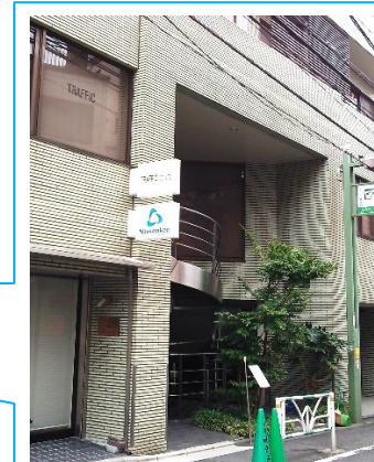
ヴィラすゞ木 地下1階

千駄ヶ谷駅を背にして、南方向へ直進。2つ目の信号を左折して100mくらい。左側のグリーンビルの地下1階(螺旋階段を下りる)。