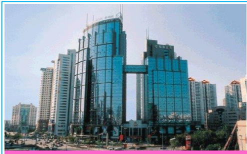
数码港旗舰大厦 2203号室

从佳世客青岛东部店(皇冠假日酒店附近)向西步行香港中路500米,到达阳光百货22楼即是。